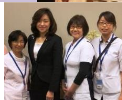
薬師寺道代議員 (無所属・愛知)