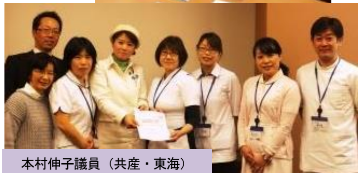
本村伸子議員 (共産・東海)