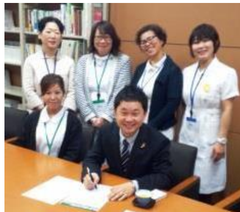
大平喜信議員 (共産・中国)