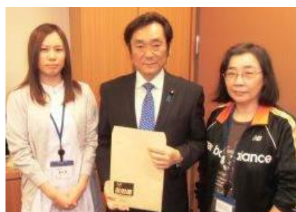
松木けんこう議員 (維新・北海道)