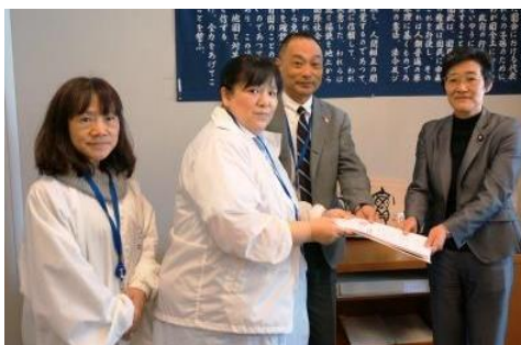
倉林明子議員 (共産・京都)