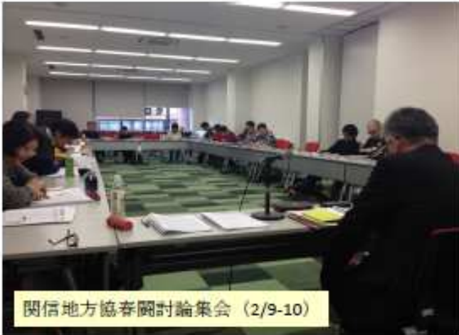
関信地方協春闘討論集会 (2/9-10)

各地方協や県医労連、単組で春闘討論集会や中央委員会が行われ、2014春闘の勝利に向けた意思統一が行われています。とりわけ4万円以上の賃上げ要求が決定し、生計費原則にもとづく要求ねりあげの討論が進められています。 4万円以上の賃上げ要求は、組合員の暮らしや要求からも、社会保障費削減の流れを変えさせることから、労働者を安く使おうとする政府・財界と対峙することからも、道理ある要求です。要求実現めざして団結して奮闘しましょう。