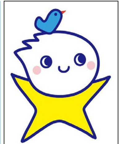
かがやく憲法マスコットキャラ↑