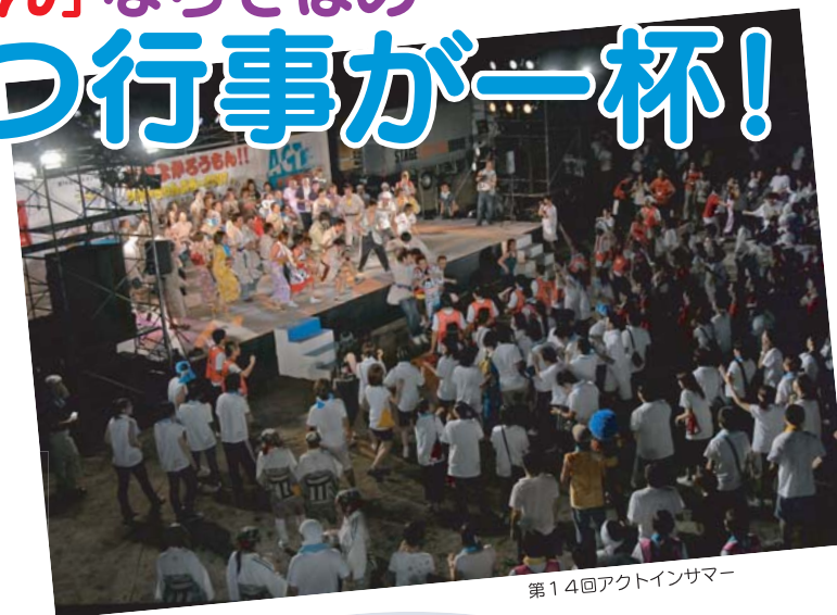
第14回アクトインサマー