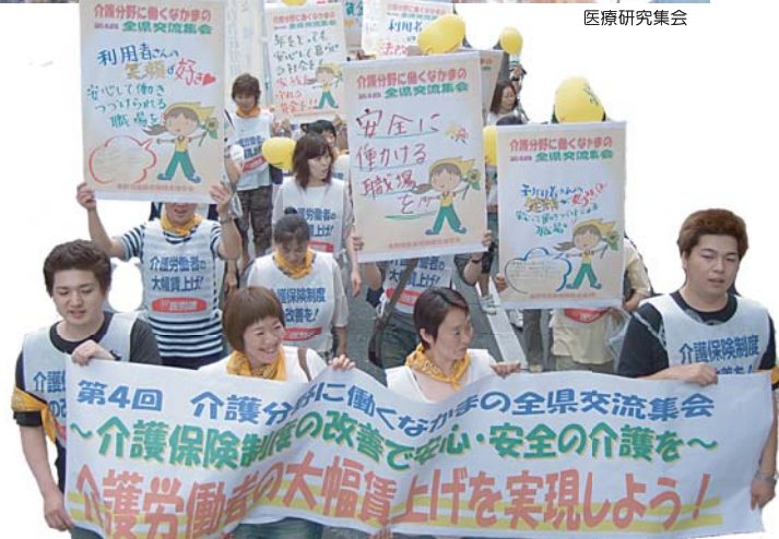
介護改善実現のために