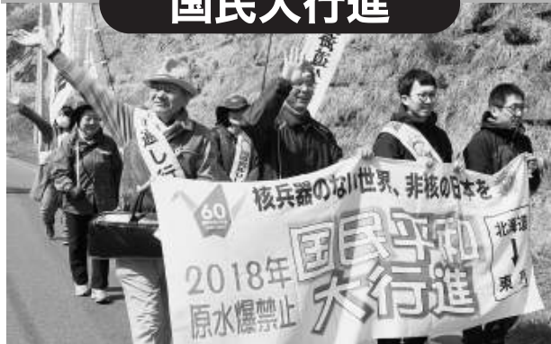
(上) 礼文島を行進する鎌倉副委員長(左から2人目)と皆さん

(右) ピースコーン・ノーモアヒロシマ、ノーモアナカサキをリズムに乗ってコールしながら日比谷公園に向けて行進しました。