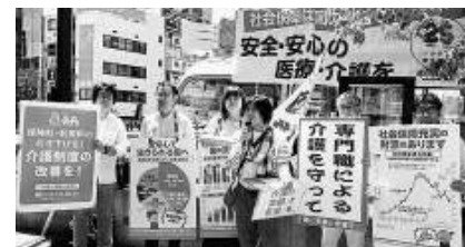
介護対策委員による5/14 楽鴨宣伝行動

○メッセージボードなどを持って、署名宣伝行動や、スタンディングに取り組みしよう。 ○地域の介護事業所や患者団体を訪問しつなごう ○介護労働者向けのセミナーや研修会を開催し、未組織労働者に参加を呼びかけ、労働組合への加入を呼びかけよう ○行動をSNSで発信しよう。(共通のハッシュタグ