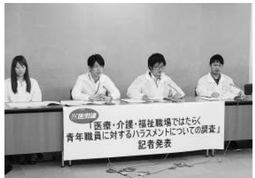
学習会参加1割強のみ

ハラスメント3割 青年協実態調査 日本医労連青年協議会は、職場でのハラスメントの実態を明らかにするため実施した調査結果を取りまとめ、5月11日に記者発表を行いました(写真下)。15名の記者が参加し、デジタル版も含めて朝日、毎日、日経、メディアファックス、赤旗が掲載、NHKは13日朝に放送しました。結果は「医療労働」5月号掲載 調査は加盟組織を通じて2017年3～9月に実施、6017人から回答が寄せられました。10年、14年に続き今回で3回目の調査です。 「労組に相談」5% 「ハラスメントを受けた時に誰に相談しているか」の設問では、先輩、上司、友人、家族など身近な人に相談しているものが、「相談窓口」や「労働組合」は7%程度です。誰にも相談していない人は15%を超えています。