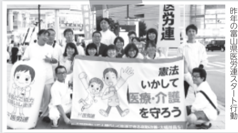
昨年の富山県医労連スタート行動

安全・安心の医療・介護をめざし、医師・看護師・介護職員増員の具体化などを求め、すべての組織が行動を集中させ、地域・世論に大きくアピールしましょう!