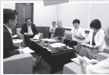
徳島県医労連の自治体との懇談の様子

要請行動では、現場の労働者が1人でも多く、現場の実態を伝えることが重要です。行動に参加できるよう提起しましょう。