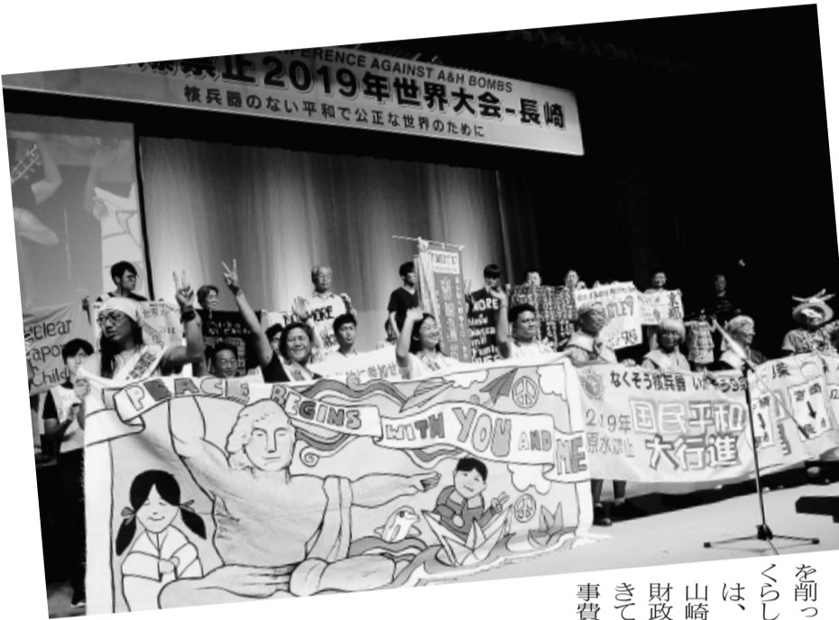
↓ 医労連産別交流会(2日目夜)