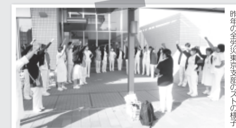
昨年の全労災東京支部のストの様子

「公務員労働者の賃金・労働条件の改善を求める署名」に取り組み、人事院への要請や、「成果主義賃金」の導入反対の取り組みを強めましょう。