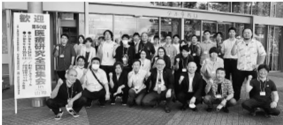
現地スタッフのみなさん(山形県医労連)