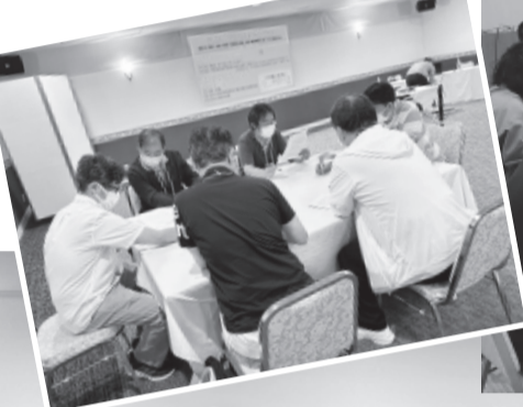
▲第1分科会「地域医療を考える」、4班に分かれグループ討論を行いました