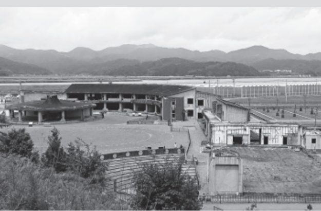
▲旧大川小学校は津波により児童108人中74人と教員10人が亡くなりました。被災前には小学校裏は多くの民家が立ち並んでいました。

動く分科会 震災被災地とさくらんぼ狩り 動く分科会は44人の参加で、県境を越え宮城県石巻の東日本大震災の被災地を訪ねました。津波で多数の犠牲者を出した旧雄勝病院跡地、旧大川小学校などを見学し、最後にさくらんぼ狩りを楽しみました。