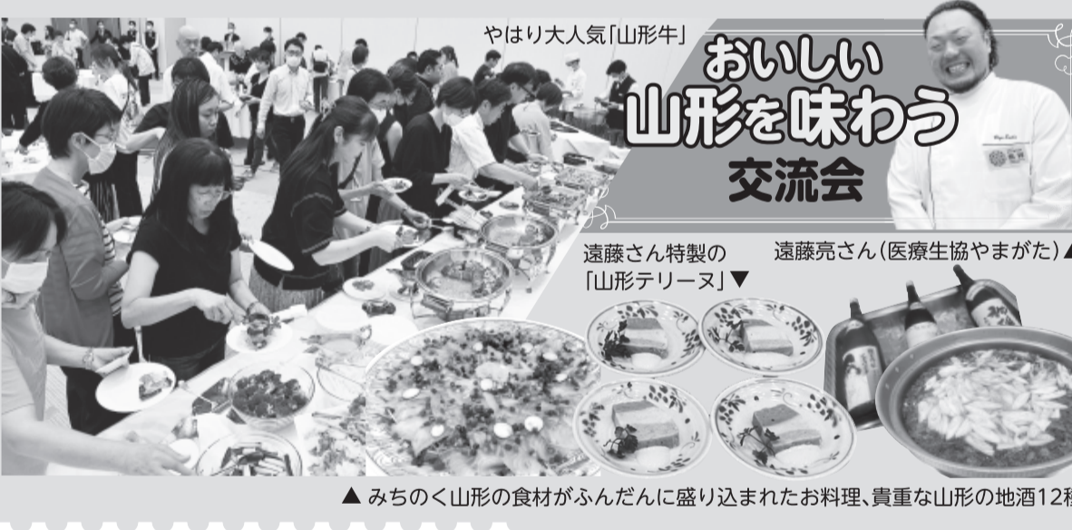
▲みちのく山形の食材がふんだんに盛り込まれたお料理、貴重な山形の地酒12種も

確立しました。第7回から地方開催された地域的な医療問題にも取り組まれました。また、基調報告の歴史から医療研活動の任務と役割が整理されてきたことや、医療研での議論が、医療労働運動を支え、国民医療を守り発展させてきたことなどを紹介しました。さらに、レポート作成準備し、講演を聞き、シンボを学び、分科会で具体的問題について議論することで本質的な問題の把握を進めてきたことが重要な特徴であり成果であったとしました。 医療研の歴史は、社会保障改革との闘いの歴史として語り継がれてきた。参加者からは、50回目を節目にふさわしい講演に感動したと感想が寄せられました。