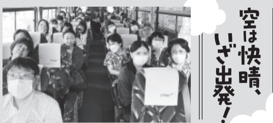
▲空は快晴、いざ出発!

動く分科会 震災被災地とさくらんぼ狩り 動く分科会は44人の参加で、県境を越え宮城県石巻の東日本大震災の被災地を訪ねました。津波で多数の犠牲者を出した旧雄勝病院跡地、旧大川小学校などを見学し、最後にさくらんぼ狩りを楽しみました。