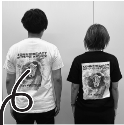
背部のデザインはこちら

←注文用紙は日本医労連ホームページ「女性のページ」もしくは、こちらのQRからもダウンロードいただけます