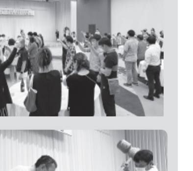
どの分科会もレポートを中心に、真剣な議論が展開されました。また来年もレポートを持ち寄り集まりましょう。