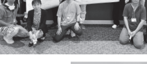
▼第3分科会「看護」、レポート発表について意見交換や、「若い看護師の離職率」などについて討論、労組としての役割を共有しました