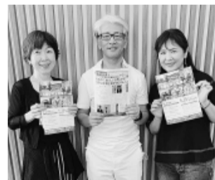
山口県から来ました