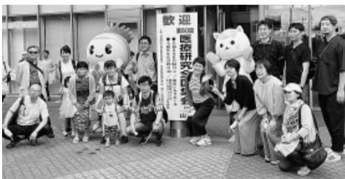
愛知県から来ました

山形県外からの参加者は「食の交流会」や郷土料理を楽しまし、山形県内からの参加者は、大きな集いで貴重な話を聞き、勉強したいと意欲を語っていました。初参加者は、分科会での発表や、他施設の事例や全国の運動を学び、今後の活動に生かしたいと熱意を話していました。