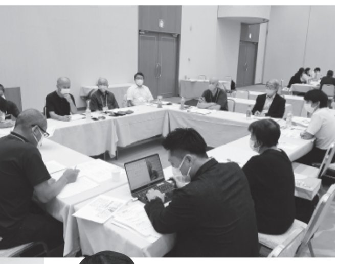
2日目は、2つのホテルを会場に13の分科会が開催されました。どの分科会も久しぶりのリアル対面でレポート発表、ミニ講演、グループワークなど多彩な運営が行われました。また大人気の「動く分科会」も青空のもと行われました。