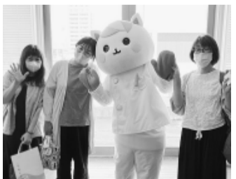
新潟県から来ました

次回開催地の和歌山から参加していた県医労連のみなさんは、50回の節目を迎えた医療研の価値を肌で感じ、次の新たな一歩を成功させたいと抱負を述べていました。