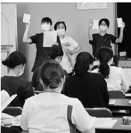
先輩職員も参加し、組合説明(全JCHO病院労組京都鞍馬口支部)

この間、最初の取り組みで加入につながらなくとも第2・第3のとりくみで加入に至った経験が多数寄せられています。