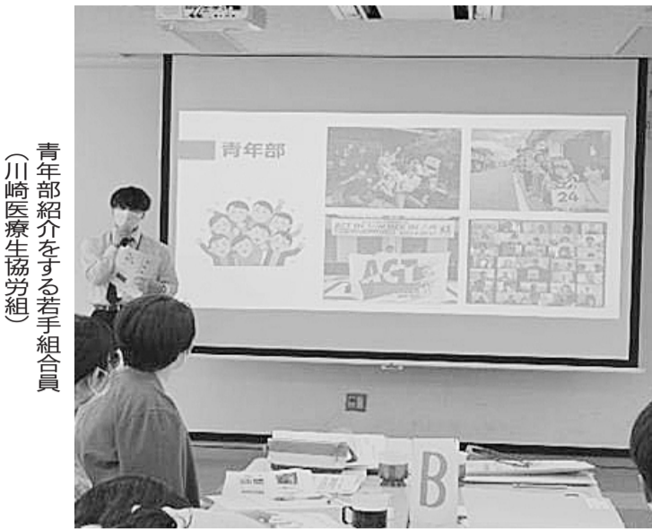
青年部紹介をする若手組合員(川崎医療生協労組)