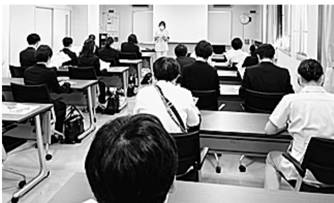
名古屋リハビリ事業団労組の新歓

この間、最初の取り組みで加入につながらなくとも第2・第3のとりくみで加入に至った経験が多数寄せられています。