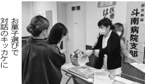
お菓子選びで 対話のキッカケに

全医労 全医労では106支部で説明会を開催し、全体で532人が加入しました。 全医労A支部では17人が説明会に参加。パワーポイントを用いて丁寧に説明し、全員を仲間に迎えることができました。 全医労B支部では夕方に説