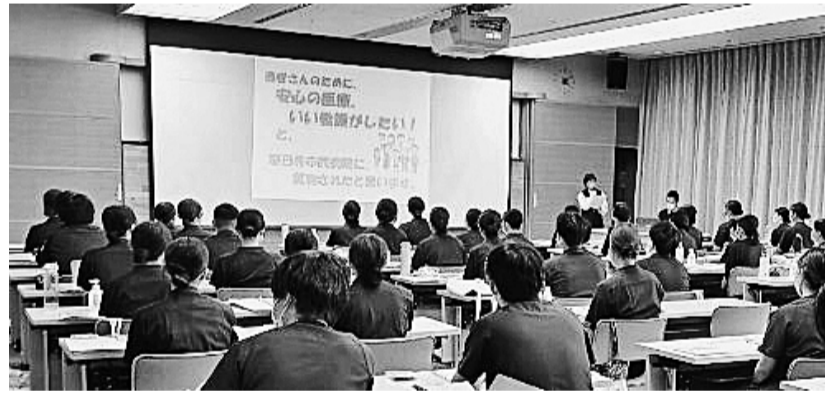
春日井市職員組合病院支部の新歓の様子