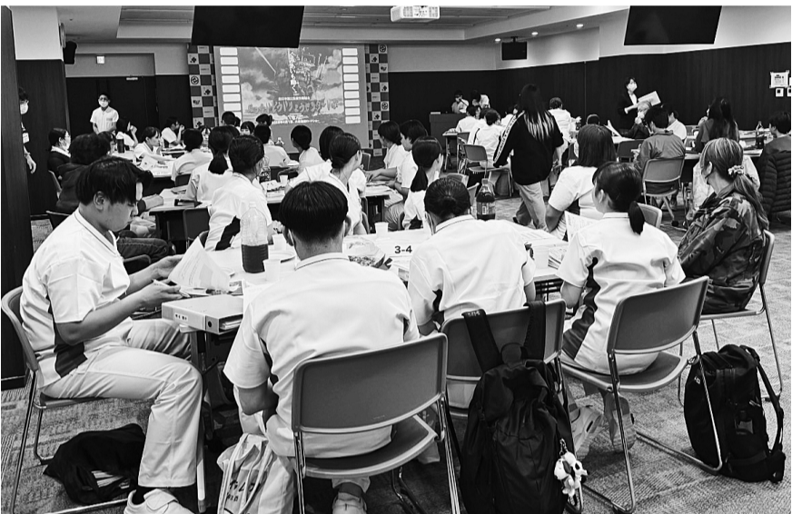
全医労北海道医療センター支部ではビザパーティ形式で大盛況