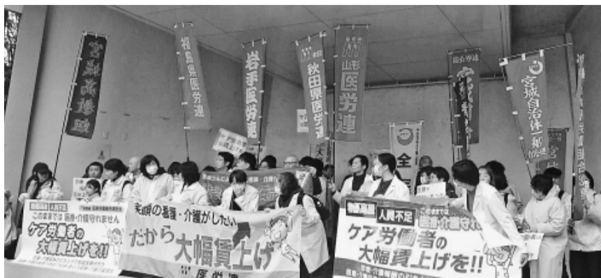
集会に集まった参加者ら

3月26日、東北地方協議会内の全ての県医労連が宮城県仙台市に集まり、統一行動を行いました。参加は東北各県から70人のほか、宮城県労連、宮城自治労連、宮城国公、全労連全国一般・宮城一般、宮城高教組、共産党宮城県議会議員らが支援と激励に訪れました。 宮城県庁前の野外音楽堂で開いたスタート集会では、6県から代表者が決意表明を行いました。それぞれの発言からは、賃金が上がらず人も集まらない現場の実態が吐露されました。そして、「ケア労働者の犠牲で成り立つ医療・介護はおかしい、大幅賃上げと大幅増員を実現しよう」と訴えました。 その後、仙台駅までのデモ