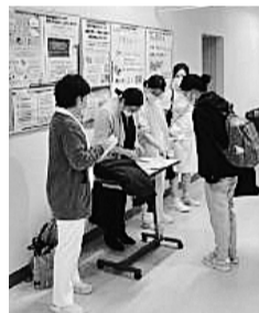
全医労旭川病院支部の新歓の様子

春の新歓シーズンが始まりました。各地で新入職員が医労連に仲間入りをした報告が届いています。新歓は年間拡大の柱となる重要な取り組みです。すべての新入職員に声をかけ輪を広げましょう。