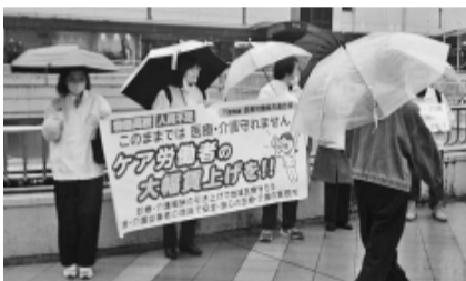
駅前宣伝行動の様子

3月26日、東北地方協議会内の全ての県医労連が宮城県仙台市に集まり、統一行動を行いました。参加は東北各県から70人のほか、宮城県労連、宮城自治労連、宮城国公、全労連全国一般・宮城一般、宮城高教組、共産党宮城県議会議員らが支援と激励に訪れました。 宮城県庁前の野外音楽堂で開いたスタート集会では、6県から代表者が決意表明を行いました。それぞれの発言からは、賃金が上がらず人も集まらない現場の実態が吐露されました。そして、「ケア労働者の犠牲で成り立つ医療・介護はおかしい、大幅賃上げと大幅増員を実現しよう」と訴えました。 その後、仙台駅までのデモ