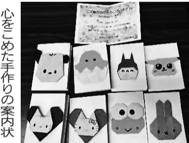
心をこめた手作りの案内状

全医労 全医労では106支部で説明会を開催し、全体で532人が加入しました。 全医労A支部では17人が説明会に参加。パワーポイントを用いて丁寧に説明し、全員を仲間に迎えることができました。 全医労B支部では夕方に説