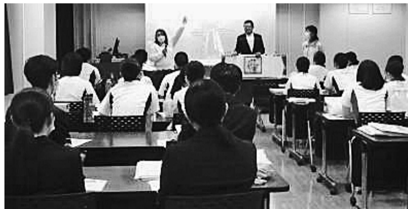
全労災岡山では手作りの紙芝居で大健闘