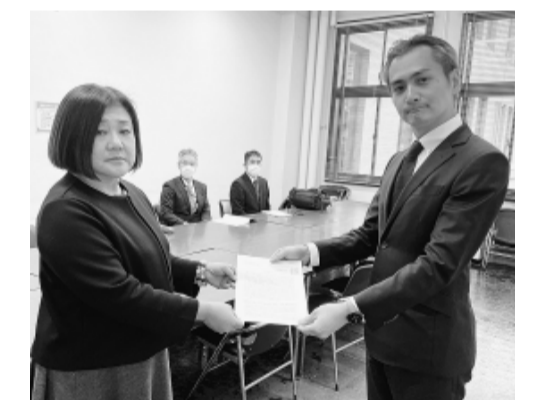
財務省交渉で質問する参加者

賃金についての交渉では、総務省としての回答はありませんでした。定年引き上げや会計年度任用職員については医療職に関する具体的な回答はなく一般的な回答となりま。ガイドラインについては「基幹病院からの医師・看護師派遣を強化する事が重要であり、地域の事情をまえた適切な取り組みが重要と制度説明に止まりました。労務管理については、ハラスメント対策の実効性を確保するための助言を行っていくと回答しました。