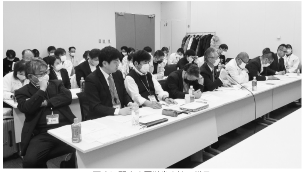
医療に関する厚労省交渉の様子

しました。看護師の平均勤続年数について6つの大病院を調査したところ、4大学が10年以上、2大学でも10年程度であり、採用不定着者数も5大学が採用目標数届いていない実態を訴えました。そのうえで、「若い人の看護師教育で中間層が疲弊し離職している。中間層が定着する職場環境改善が必要」と指摘しました。文科省で把握している離職の推移について問うと、ほぼ10%以下