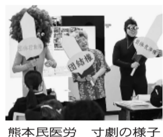
熊本民医労 寸劇の様子

年間拡大数の6〜7割を占める新歓が 始まりました。重要な一週目の取り組み を終え、全国で2700人をこえる新入 職員が医労連のなかまになっています。