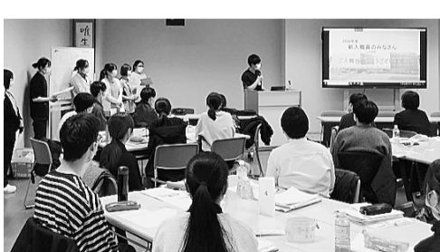
新潟民医労 新歓の様子

第2・第3弾のとり くみで新人加入10 0%を実現しよう まだ声をかけられていない ・加入を迷っている新入職員 がたくさんいます。職場で再 度の声掛けを進めるほか、「給 与明細の見方」学習会や共済 説明会、新入職員向けの退勤 時間調査など次の企画を計画 し、全ての新入職員に声をか けきり、新人加入100%の 実現をめざして加入の呼びか けを進めましょう。