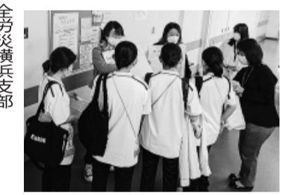
全労災横浜支部 シールアンケートは大好評

をすすめ、加入に結びました。 新潟民医労は、4月4日の 新人オリエンテーションの時 間内に組合説明会を開催しま した。急遽、執行委員長と支 部長が不在となるアクシデン トがありました。青年部部 長、副部長、各職場の若手ス タッフが大奮闘！研修医4人 を含む29人全員が説明後即加 入で大成功となりました。