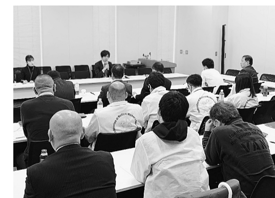
労働に関する厚労省交渉の様子

現場の実態は決して「不快」と改善を求めました。ハラスメントの相談窓口の設置について、参加者から小規模の施設では相談窓口となる職員がラッサーと同一人物となることもあり、相談できないケースが多い。個人のタイムカードの設置が進んでいない実態を訴え、たところ、監督課からは「パソコンの使用記録など、客観的に労働時間の把握を行うこと。年度毎の労働時間の管理状況について調査結果を産業別に公表している」と回答がありました。 有期雇用労働者の「無期雇用転換」の適正な実施については、「職場の規定の更新上限に達すれば雇止めを同じ職種・同じ労働内容に対して募集が行われている」と実態を告発。無期転換を回避するための脱法的雇止めに対し、指導・改善を求めました。