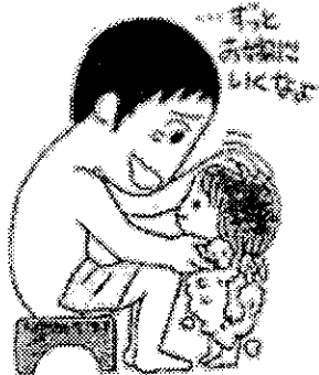
「育メンノート」のイラストより

全国の労働組合の中には、結婚や出産を機に「パパ」に「育メンノート」をプレゼントするなど、活用が広がっています。すでに3