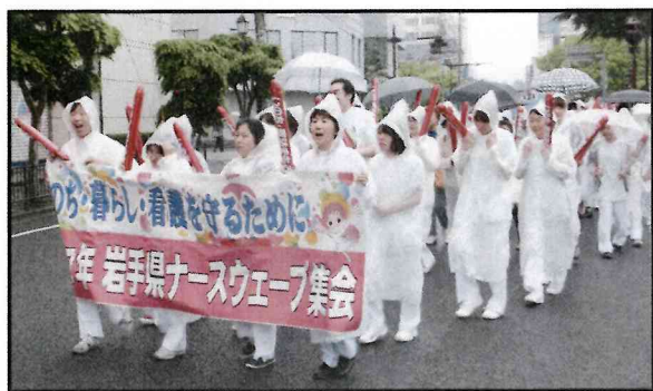
(雨の中アピール行進)