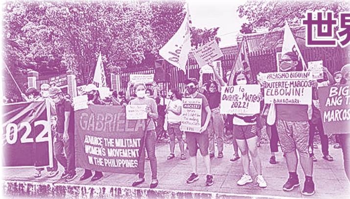
フィリピンのガブリエラ女性連合-2022年の大統領選挙に向けて