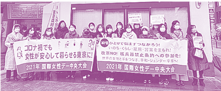
2021国際女性デー中央大会宣伝行動・リレートーク (3月8日)

1923年、婦人講演会として開いたのが最初。天皇制国家の弾圧で集会を開けなくなっても、個人宅で集い、女性デーを守りつづけました。1947年には戦後初の女性デーが皇居前広場で開催され、49年には1万5000人が日比谷小音楽堂前広場を埋めつくしました。その後も、女性の切実な課題をかがげて毎年開催され、平等・開発・平和をめざす世界の女性運動と連帯して発展しています。