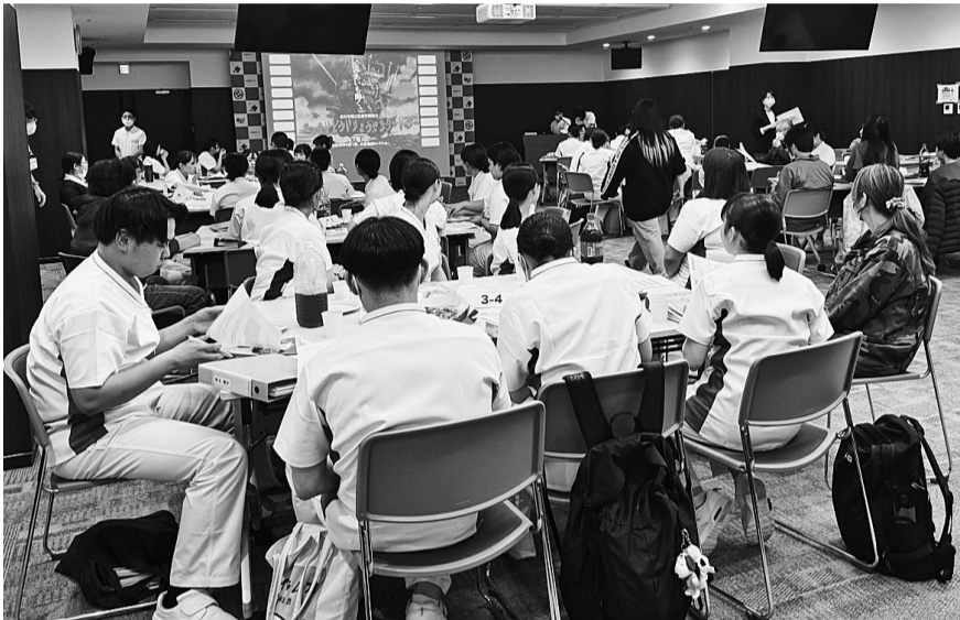
全医労北海道医療センター支部ではビザパーティ形式で大盛況