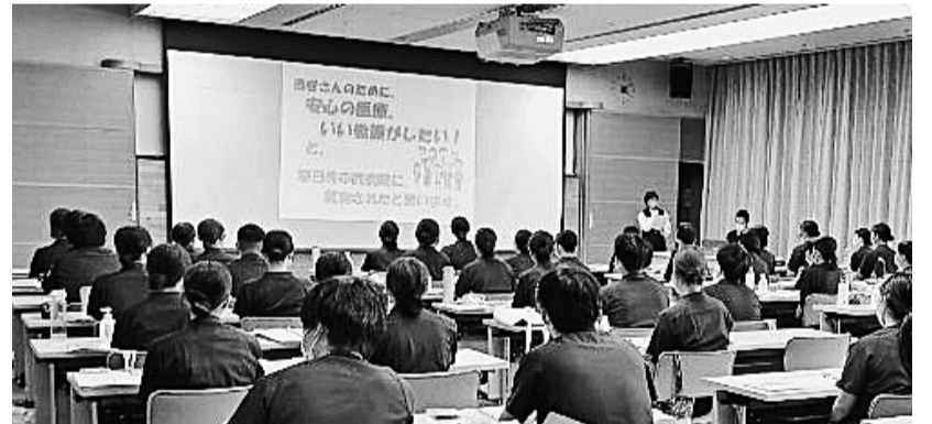
春日井市職員組合病院支部の新歓の様子

全JCHO病院労組 全JCHO病院労組北海道支部は、昼休みに説明会を開催し、50人が参加。昨年の99%加入の実績を強調しつつ「仲間をふやすにはBOOKに沿って実践し、24人が加入しました。」