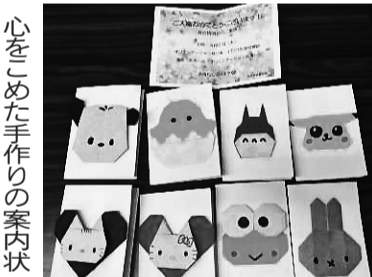
心をこめた手作りの案内状

全JCHO病院労組 全JCHO病院労組北海道支部は、昼休みに説明会を開催し、50人が参加。昨年の99%加入の実績を強調しつつ「仲間をふやすにはBOOKに沿って実践し、24人が加入しました。」