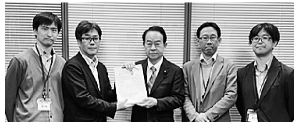
野間たけし衆議院議員(中央)に署名手渡し

【最終署名提出集会】 5月26日(火) 10時30分 厚労省要請 12時00分 集会開始 【会場】 衆議院第2議員会館