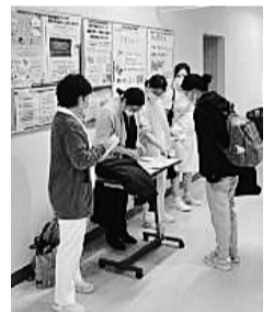
全医労旭川病院支部の新歓の様子

全医労 全医労では106支部で説明会を開催し、全体で532人が加入しました。 全医労A支部では17人が説明会に参加。パワーポイントを用いて丁寧に説明し、全員を仲間に迎えることができました。 全医労B支部では夕方に説