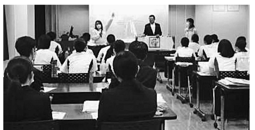
全労災岡山では手作りの紙芝居で大健闘

全労災 全労災では各支部で新歓が開催されています。岡山支部では、県医労連が作成した、医労連共済と組合説明についての手作りの紙芝居を活用し、40分という時間を飽きさせないよう創意工夫した説明会を行いました。