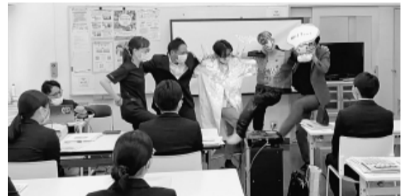
熊本民医連労組では新入職員も参加した寸劇が大盛況

では、オリエンテーションの最後に説明し、30人中14人が加入と大きな成果。共済への関心が高く、熱心に耳を傾けていました。 和歌山・那賀病院労組でも組合説明会を実施しました。「みんなの助け合いアンケート」を活用して全員に記入してもらい、新人30人全員が組合に加入しました。 熊本民医労の説明会では「200年後の労働組合がない世界」をテーマに寸劇を