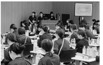
市従福祉衛生支部の新歓の様子

横浜市大病組では2つの支部で説明会を実施。センター病院支部では先輩方が勝ち取ってきた成果や国会議員への要請行動などの活動をパワーポイントで紹介。あわせて青年部からは、猿島BBQや中華街ランチ会など楽しい企画も紹介し、96人が加入に繋がりました。附属病院支部でも、ろうぎんの紹介や共済アンケートを活用。崎陽軒のシウマイ弁当も好評で、94人がその場で加入。今後は100%加入に向け、引き続き配属先での声掛けを進めていきます。茨厚労では支部ごとに新人加入説明会を実施。取手支部