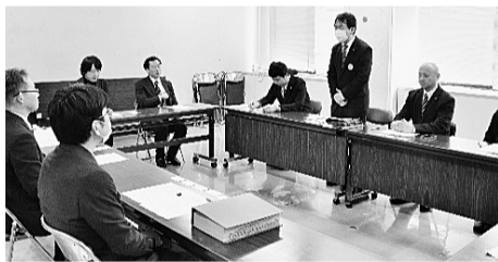
山形の対県要請行動の様子

4月9日は26春闘第2次統一行動日でした。ご報告いただいた様々な行動の中から、一部を紹介いたします。 増やしてなんとか生活を維持させている」と悲痛な訴えがありました。 山形県医労連では、4月8日に第2次いっせい団交を設定して7単組が実施し、翌9日には県内で終日行動を展開しました。5単組が2時間ストを実施したほか、4単組20人が山形駅前で署名宣伝行動を行いました。また「報酬10%引き上げ」を求めて8人で県要請を実施し、県担当者からは国への要望を行う旨の回答を得ました。夕方に開催した決起集会には6単組33人が参加し、次回交渉で大幅な上積み回答を引き出す意思統一を行った後、街頭スタンディ