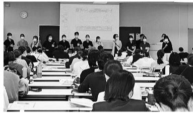
横浜市大病組附属病院支部の新歓の様子

26新歓もいよいよ後半戦。4月21日時点で3000人を超える新入職員が医労連のなかまになっています。引き続き、第2、第3の取り組みで新人加入100%をめざして奮闘しましょう。 青年部の楽しさで加入続々 神奈川県医労連では、組合説明会に県医労連青年部が参加し加入を呼びかけ、なかまを増やしています。さらに、単組同士の交流も進み、組織強化へと発展しています。横浜